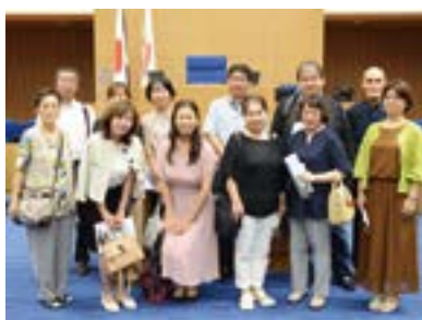
集合写真(会議場にて)