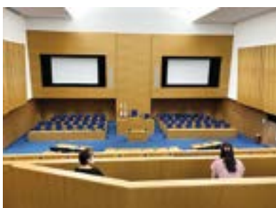
本会議場を上から撮影