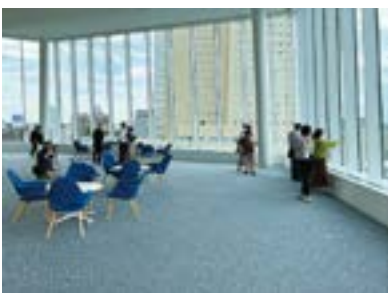
みなとみらいの景色を一望できるラウンジ