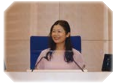
思い思いの席で・・・(本会議場)