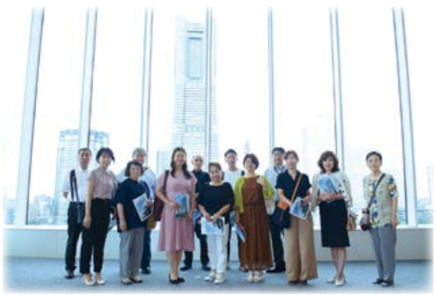
ラウンジにて ランドマークをバックに