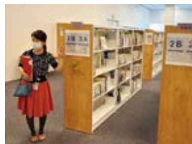
常任委員会ごとに図書や資料を配架してある図書室