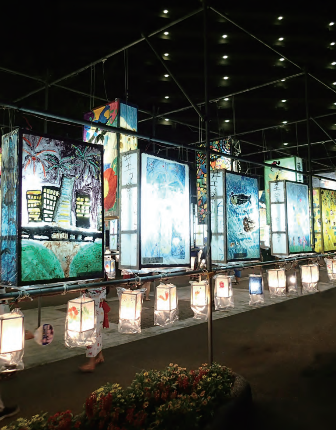
南まつりの夜を幻想的に照らし出す「子ども絵どうろう」