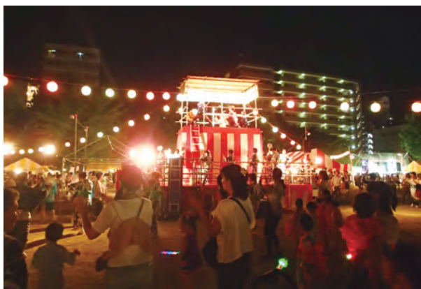
～大人も子供も輪になって踊ります 大盆踊り～