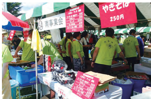
～初めてのくまモングッズの販売コーナー～

昨年と桜まつりに引き続き、焼きそば、フランクフルト、飲み物、そして今年はくまモングッズの販売もしました。