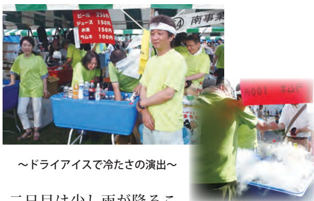
～ドライアイスで冷たさの演出～

予想通り、18時を過ぎた頃にはだんだんと列ができはじめあつという間に出来上がり在庫がなくなってしまふほどの売れ行きになっていました。お祭り終了時間まで行列が途絶えることがなく一日目の分は売り切って気持ちよく終わることが出来ました。