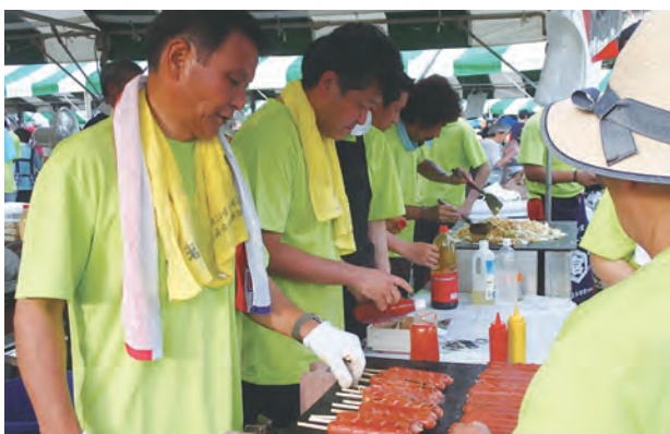
～暑さと鉄板の熱さでほとばしる汗～

少しでも多くの方が「南まつり」に参加していただき「南事業会」を知り興味を持っていただければ幸いです。