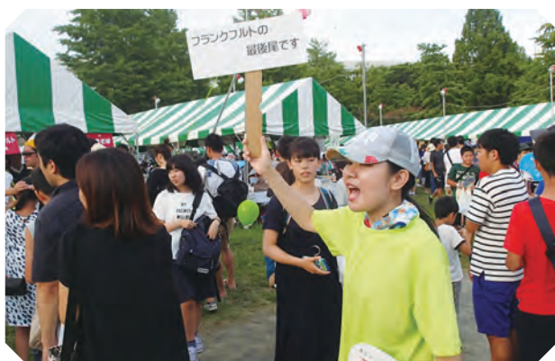
～大盛況のため、最後尾のお知らせ～

その列はまたしても途絶えることがなく終了時間になってみれば、有りがたいことに二日間で、焼きそば 1,020食、フランクフルト 2,390本、そして飲み物、すべて完売！！！！