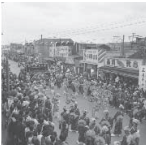
昭和32(1957)年 国際仮装行列

前回Vol.101で南区制80周年事業のひとつ、「みんなでつくる南区動画」に参加しようと懐かしい仕事の写真を大募集しましたが、残念ながら思うように集まりませんでした。従いまして、この企画は流れましたが、南区役所から昔の写真をお預かりすることが出来ましたので、掲載いたします。