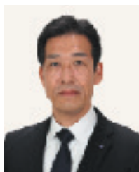
南区長 高澤 和義

区制50周年の時から今も変わらず使っているキャッチフレーズ「南の風はあったかい」は、まさに南区を表す象徴的な言葉です。私も地域に足を運び、皆様のご意見に耳を傾け、ときには厳しい言葉をいただきながら、皆様の南区を