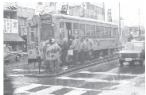
昭和47(1972)年 市電三吉橋停留所