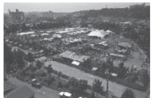
昭和53(1978)年 横浜開港記念バザー