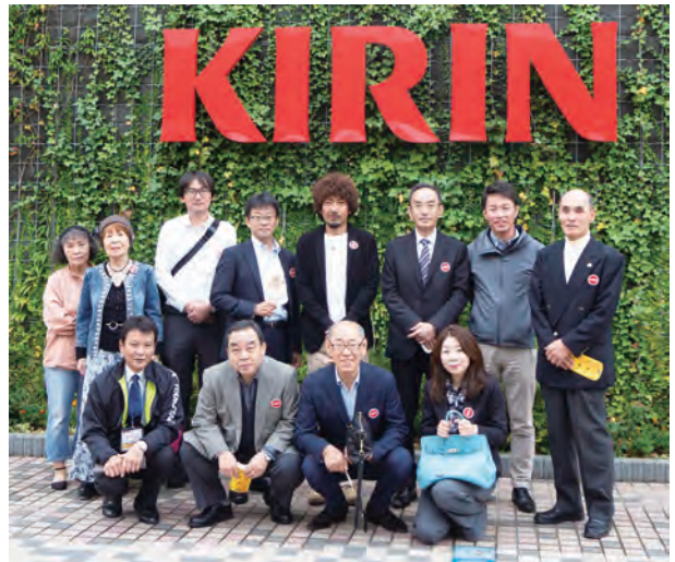
ハイチーズ…じゃなく ハイビール！

当日は雲行きが怪しいので到着後直ぐに集合写真撮影しましたが、何とか最後まで雨には降られずすみしました。