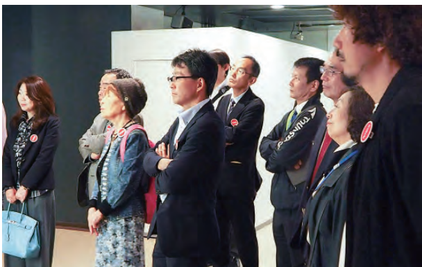
皆さん真剣に聞いている様子

大半はチェコ産など使用している「ホップ」は苦みと香りをだし、ビール之魂と言われており非常に神経を使っているようです。