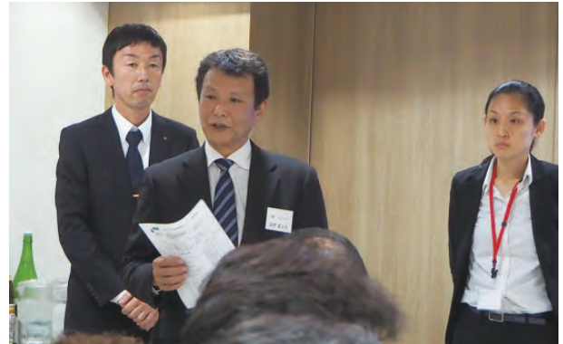
浦野事業企画委員長の挨拶と 講師の方の紹介