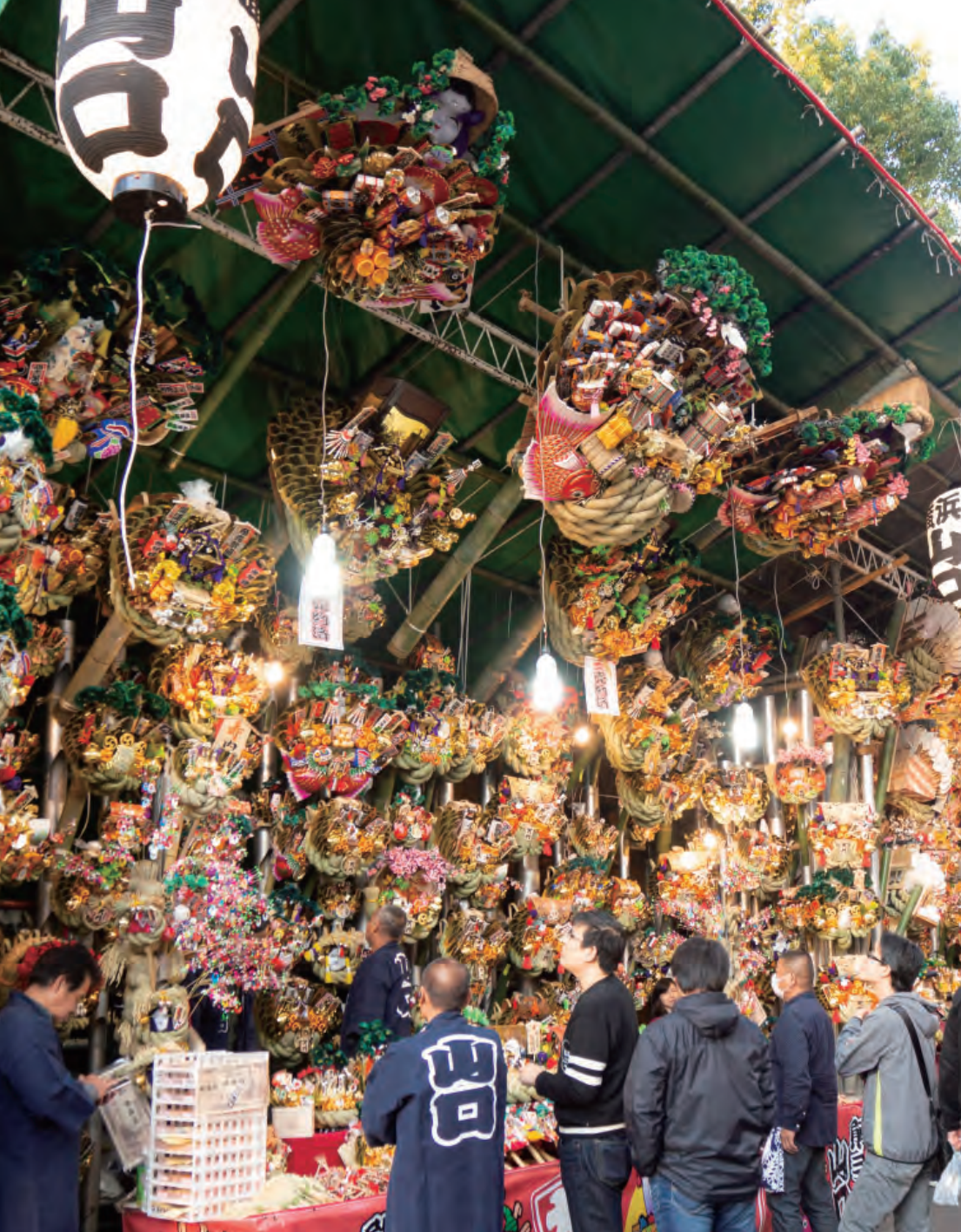
福運をかき集める縁起物 ～金刀比羅大鷲神社西の市～