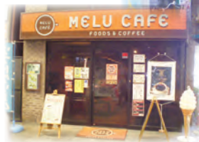
カフェ MELU CAFE