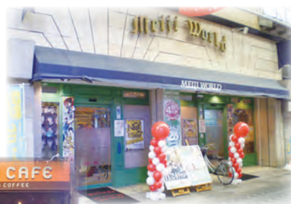
パチンコ メイジワールド