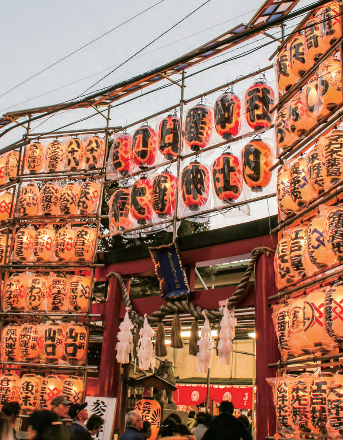
酒の市で賑わう金刀比羅大鷲神社